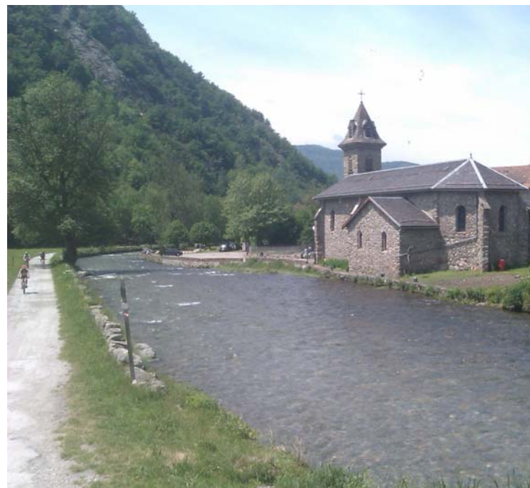
A quelques kms d'Ax-les-Thermes