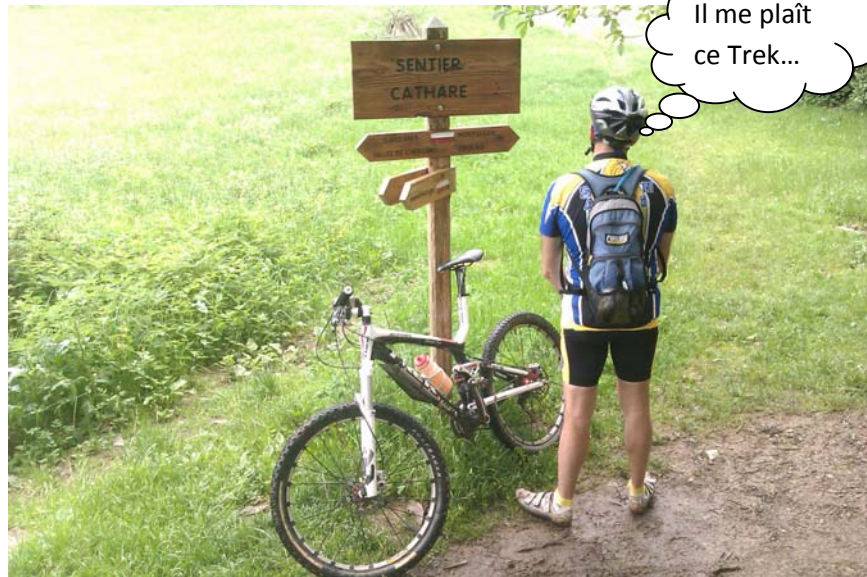
Notre guide spirituel médite...