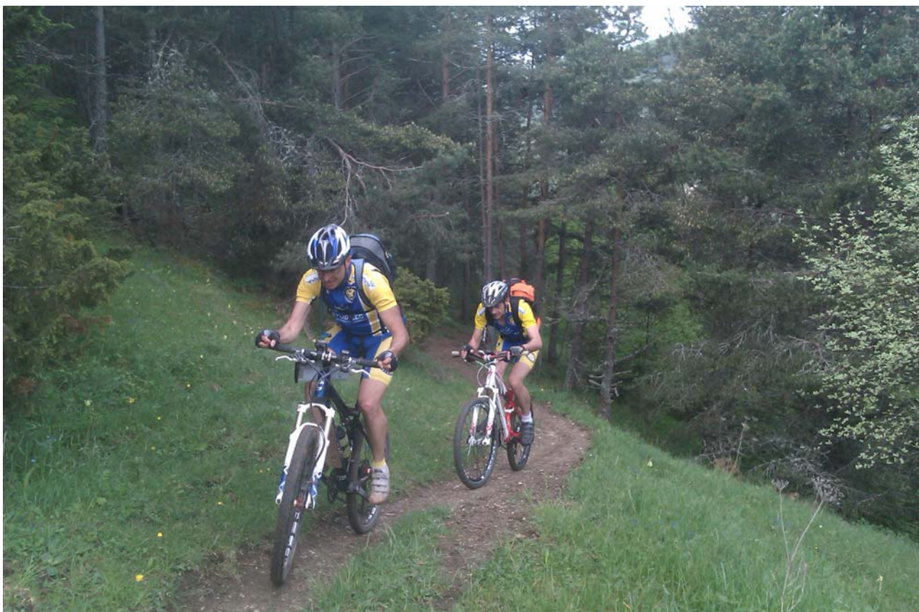
On teste la moulinette...