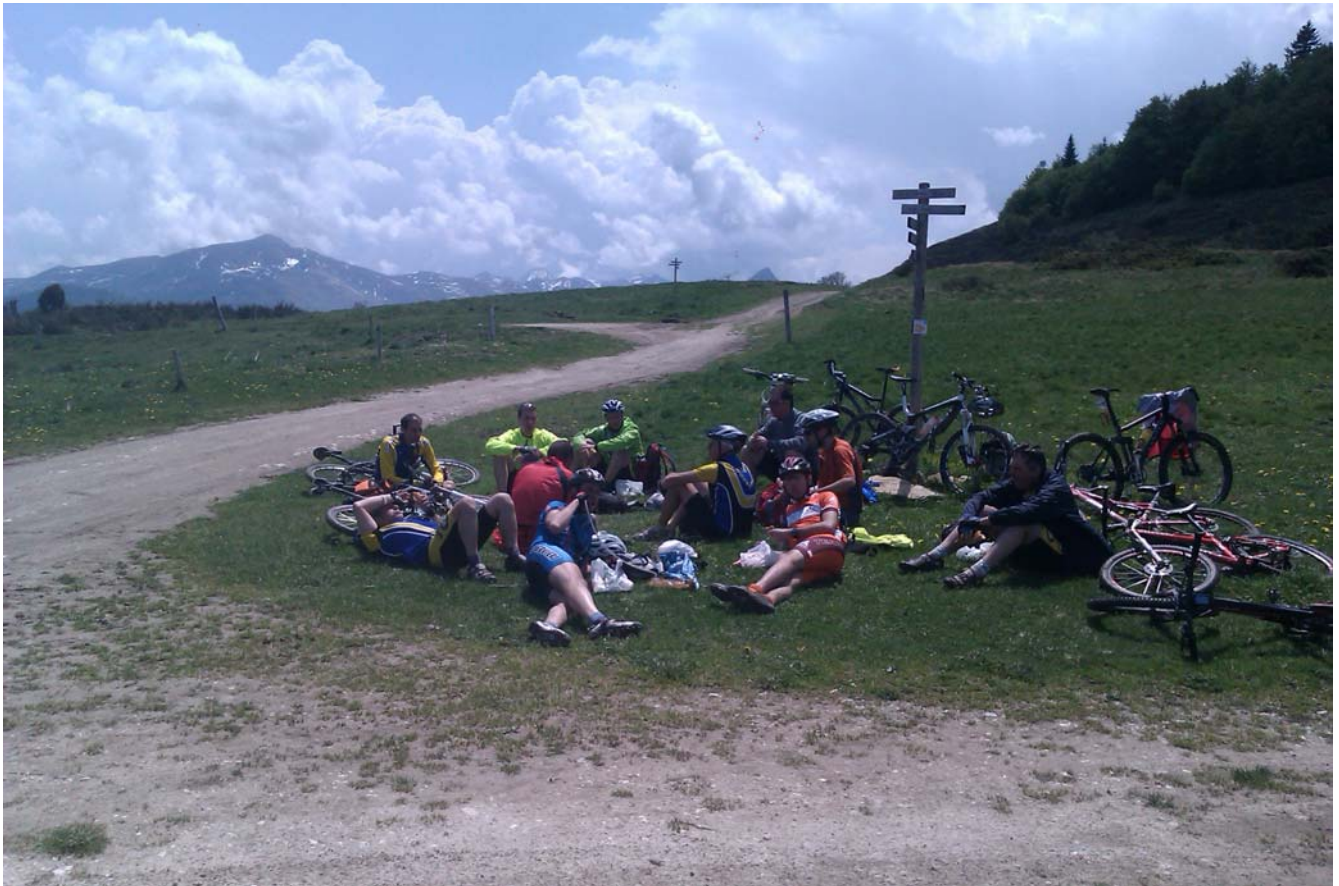
Pause casse-croûte au sommet du Pla de Lagarde à 1605m

peureux de ce phénomène naturel, je décide de rester au sec et de rentrer direct au gîte avec 6 autres raideurs en passant par un chemin à profil descendant emprunté dans l'autre sens le samedi. Nous voilà arrivés secs et saufs. On en profite pour faire une petite boucle supplémentaire de 5km autour du charmant petit village de Comus notre point sommeil pour récupérer de cette journée. Il y a vraiment de quoi faire dans cette vallée paisible de l'Aude frontalière avec l'Ariège. Au final 45km et 1600deD+. Nos valeureux collègues ayant décidé de faire le circuit en entier ont finalement été épargnés par la pluie et ont pris du plaisir sur une belle descente herbeuse et ludique. Au final 50km et 2000 D+ au compteur. Sitôt arrivés nos montures sont lustrées et huilées prêtes à repartir. Pour leurs pilotes une bonne douche, un apéro de récup et déjà une bonne odeur s'échappe de la cuisine mettant l'eau à la bouche du repas qui nous attend.