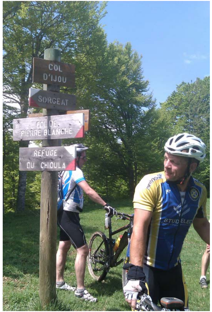
Single très sympa