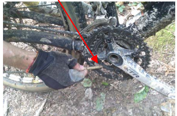
Nettoyage au bâton svp...