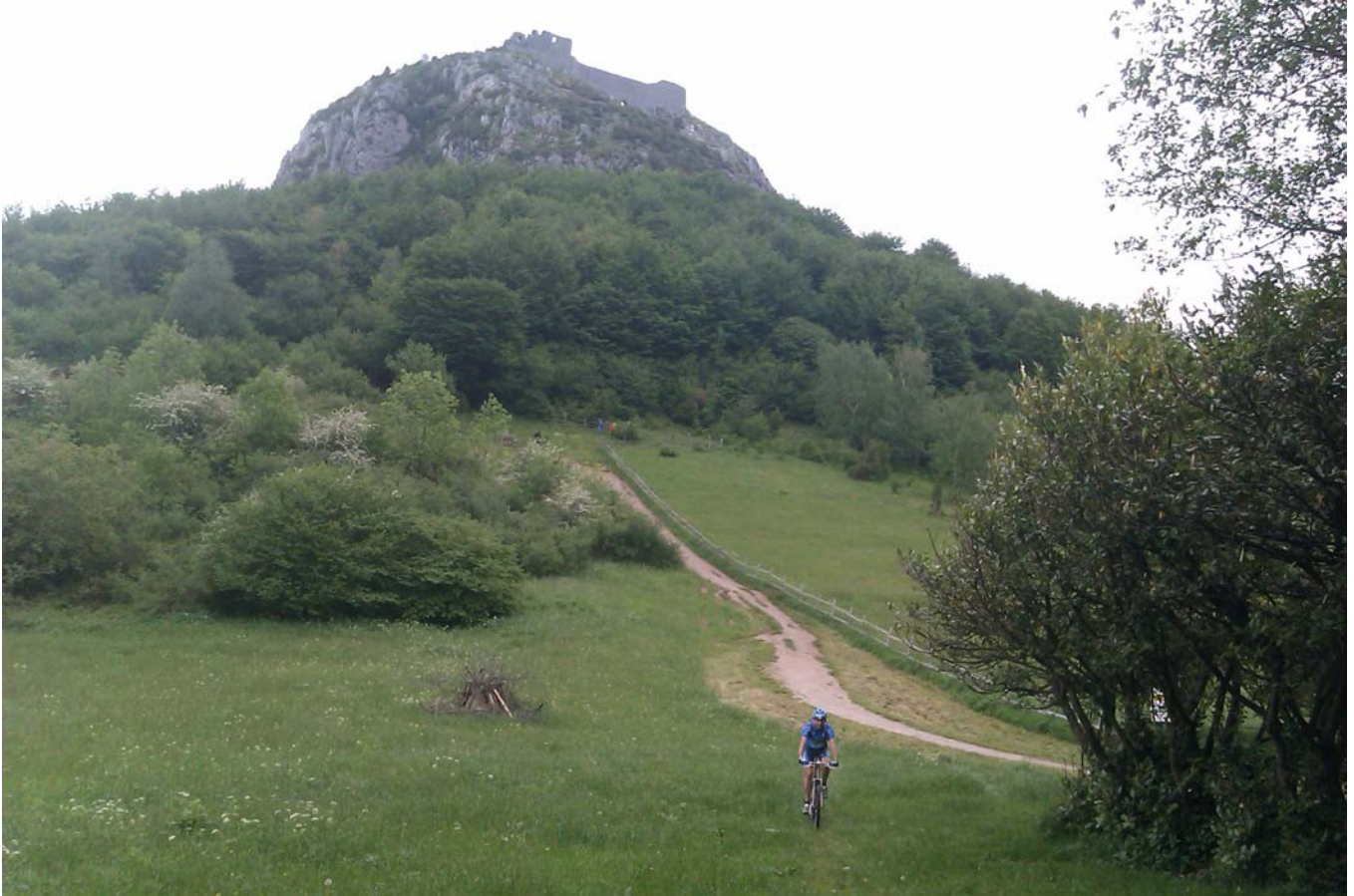
Château de Montségur