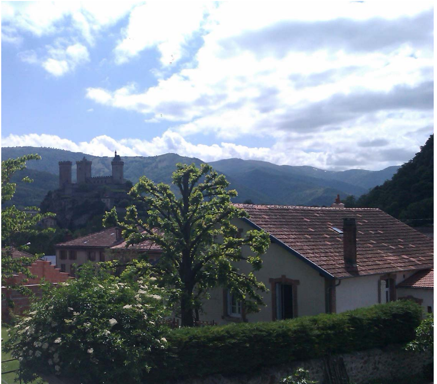
Château de Foix, fin du périple...