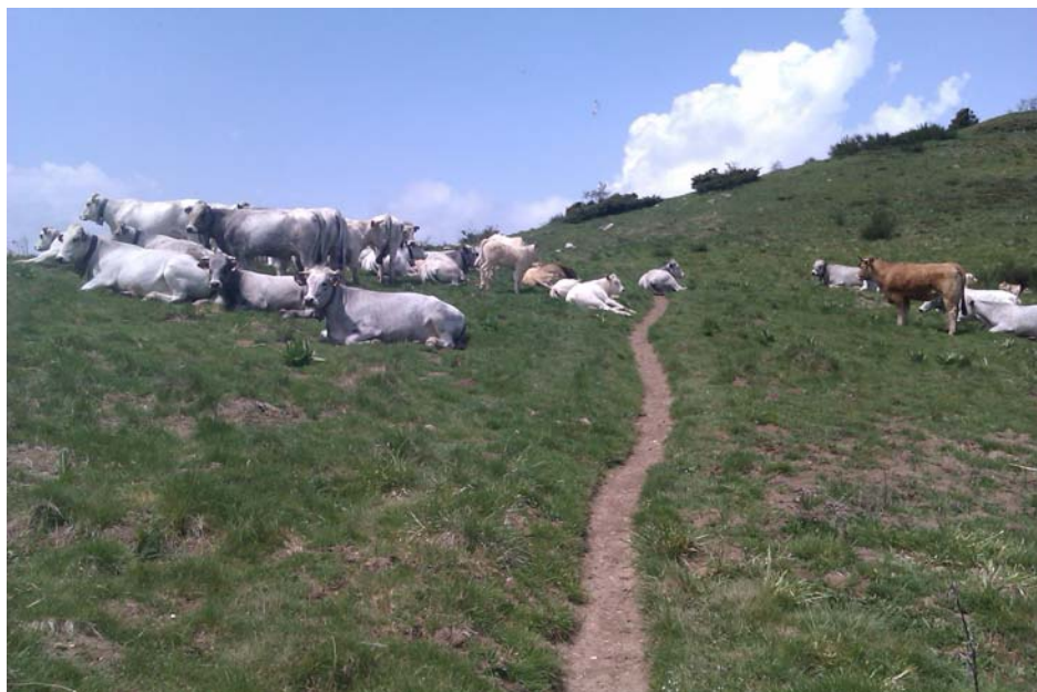
Les vaches apprécient les singles, notre brebis tarnaise aussi