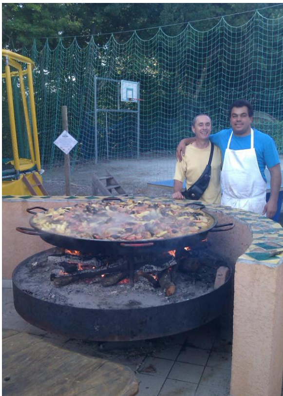
Patrick et la potion magique

noter pour l'an prochain. Mais au final elle s'est quand même régalée. Dans la soirée, direction le camping de Villegly pour une soirée paella histoire de faire le plein de sucres lents.