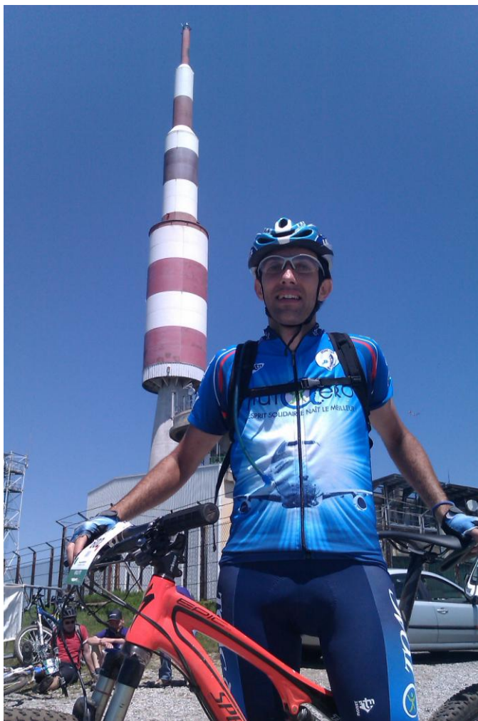
Pic de Nore 1210m le plus dur est fait...

parcours les organismes sont soumis à rude épreuve. Je ne sais pas si c'est la magie du 29 pouces ou une bonne fraîcheur physique mais je les aborde sans problème, tous les concurrents que je rattrape sont plus ou moins en train de râler, ils subissent le terrain, de mon côté je survole les cailloux c'est presque déroutant. Dans les descentes je ne me concentre que sur le pilotage, le reste se fait tout seul, tout passe, les marches, les virages serrés, bref c'est le top. On attaque à nouveau un single à flan de montagne magnifique, je vois un petit groupe dont un collègue de Cornebarieu autour d'un concurrent allongé. Il me signale qu'il a une blessure à la jambe, heureusement les pompiers sont déjà en train d'arriver, à pied, car la zone est inaccessible autrement. Ce parcours est exigeant, et le manque de lucidité se paye cash. Je laisse le petit groupe qui a bien géré la situation et reste encore plus concentré pour finir cette belle épreuve. Je reconnais les chemins que nous avons emprunté la veille avec Thierry lors du circuit de 25km, l'arrivée est proche, encore une belle descente, les sensations sont vraiment bonnes sur cette fin de circuit, on roule sur les palettes, on passe sous le petit pont, on entend notre speaker international Eric Davaine.